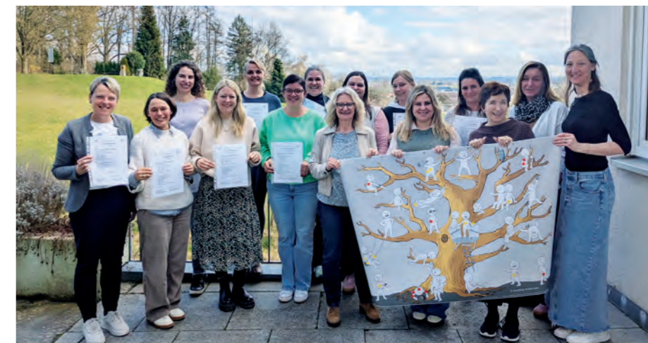
Die Teilnehmerinnen der Qualifizierung Qualitätsmanagement zusammen mit den Dozentinnen

Für den Aufbau, die Einführung, die Beratung und fachliche Fortführung eines QM-Systems braucht es Kompetenzen und Kenntnisse zur DIN EN ISO 9001:2015 und zur Handhabung der Qualitätsmanagementmethoden.