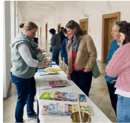
Interessierte Besucherinnen an den Infotischen