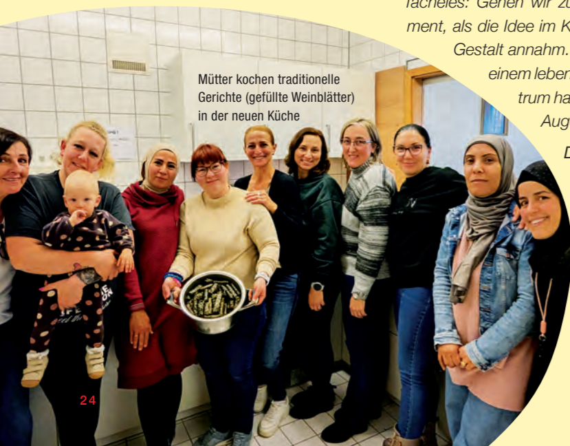
Mütter kochen traditionelle Gerichte (gefüllte Weinblätter) in der neuen Küche

Ihre Bedarfserhebung hatte aufgezeigt, dass Eltern sich vor allen Dingen Unterstützung in Erziehungsfragen und dem familiären Miteinander wünschen. Woran haben Sie bei der Premiere Ihres Familiencafés gemerkt, dass Sie dem Bedarf der Familien damit wirkungsvoll begegnen?