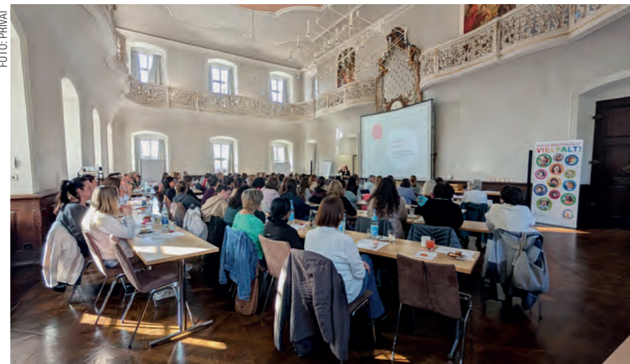
Rund 200 pädagogische Fachkräfte nutzten die Fachtage, um neue Impulse für ihren Kita-Alltag mitzunehmen

Fachtage in Schöntal und Heilbronn gut besucht