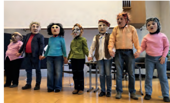
Beitrag des Integrationstheaters Companie Paradox aus Ravensburg

Auffälliges Verhalten wurde konsequent als Bewältigungsstrategie verstanden. Jedes Verhalten hat einen guten Grund – auch wenn die Folgen für andere schwierig sein können.